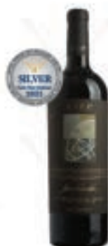
카베 핀카 벤칼레스 Cave Finca Bencales