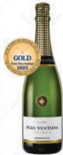
베레 벤투라 브루트 레저브 브릿 Pure Ventura Cave Brut Reserve