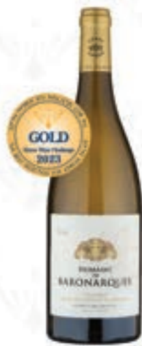
도메인 바누앵 블랑 Domaine de Bannuquans Blanc