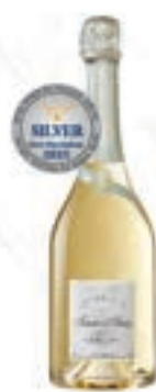
도츠 아우르 도츠 Deutz Amour de Deutz