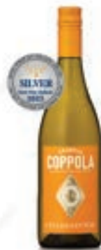
코폴라 다이아몬드 컬렉션 샤토네 Durec Collection Durec