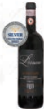
모르네-레지앙의 레모인 레베르타 레 베르테 Lemoine Durec Dextro Reserve Le Berthe