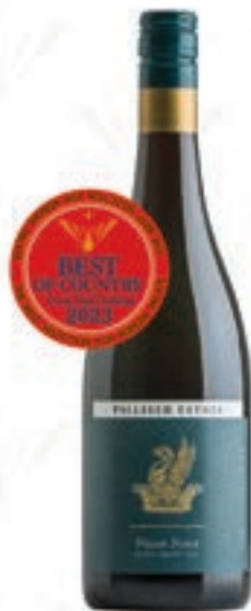
팔리서 피노누아 Paliser Pinot Noir

Best of Country 1개 | Gold 4개 | Silver 7개 | Bronze 8개