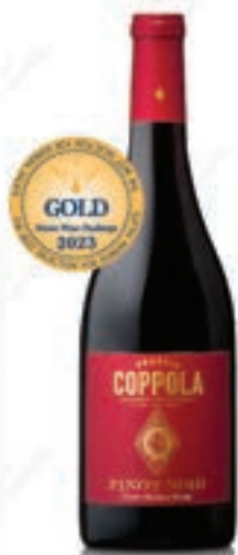
코폴라 다이아몬드 컬렉션 산타 바바라 피노누아 Diamond Collection Santa Barbara Pinot Noir