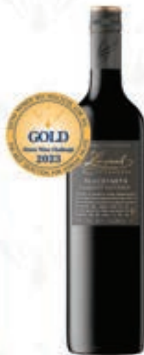
랑메일 블랙스미스 자메르네 쇼비뉴 Langmeil Blacksmith Cabernet Sauvignon