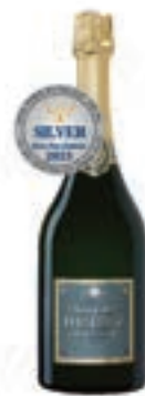
도츠 브릿 클래식 Deutz Brut Classic