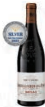
델라스 샤토 네프 뒤포아 Delas Châteaufort-du-Poit